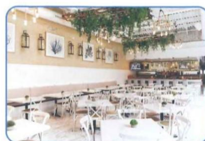
飲食店 接客・スタッフの体調管理