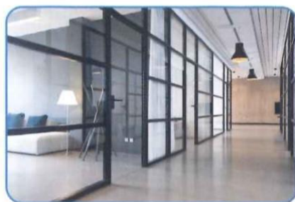
オフィスビル・テナント 入社・退社時のスタッフの検温・体調管理