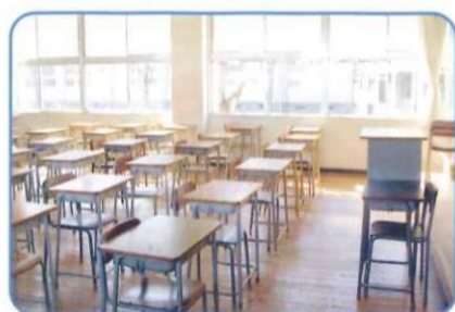
学校 学生たちの体調管理