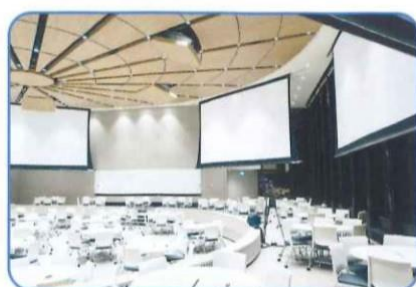
イベント会場 入場確認時の検温を実施