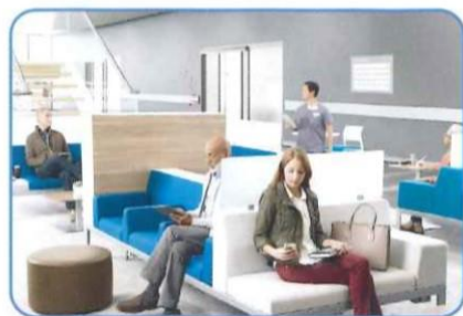
医療機関受付(病院) 検温とマスク着用の確認

多くの人が集まる、公共交通機関や医療機関、学校、商業施設、オフィスビル、飲食店、スーパーマーケットなど 検温や顔認証を非接触でスムーズに行うことができ感染症予防に役立ちます。