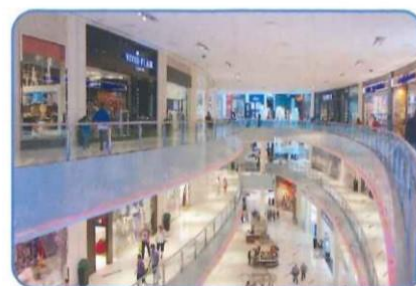
商業施設・スーパーマーケット お客様の入場前に検温・ケア